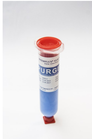
Abgebildetes Produkt kann vom gelieferten Produkt abweichen

Das Interflux® Purgel ist entwickelt worden um Ventile, Pumpen und Jet-Systeme von Dispensgeräten zu purgieren, reinigen und pflegen, ohne dass, das Gerät auseinandergebaut werden muss. Es pflegt diese Teile für längeren Stillstand, so dass sie bereit sind für den nächsten Einsatz.